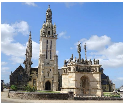
Enclos de Pleyben