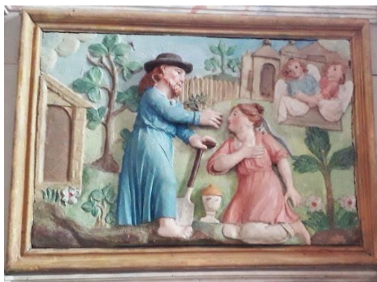
Chapelle St-Sebastien, Apparition à M-Madeleine

Vers 14 h45 : visite guidée de l'enclos et de la chapelle SAINT-SÉBASTIEN dont le chevet est couvert de retables baroques très colorés et de tableautins fantaisistes ; entre autres, celui du transfert légendaire de la maison de la Vierge à Lorette (culte répandu au XVe siècle dans le Finistère)